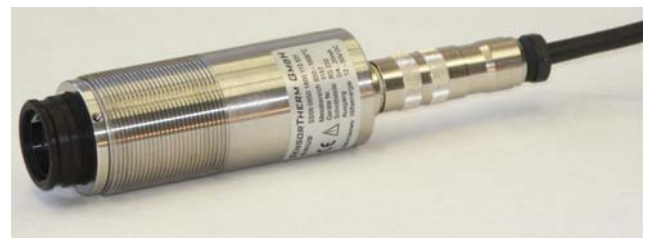
Sirius -Pyrometer im Edelstahlgehäuse mit AK43

Objektive: Die vom Messobjekt ausgehende Infrarotstrahlung wird über werkseitig fokussierbare Objektive auf den Detektor übertragen. Für die Objektive wird das optische Glas BK7 verwendet. Eventuell notwendige Fenster sollten aus einem Material mit vergleichbaren Transmissionseigenschaften bestehen. Tabelle 2 beschreibt den Verlauf des Strahlengangs der Objektive. Als Strahlengang bezeichnet man den kegelförmigen Bereich zwischen Objektiv und Messobjekt, in dem die vom Messobjekt ausgehende Infrarotstrahlung übertragen wird. Der Durchmesser des Strahlengangs am Objektiv beträgt ca. 14 mm (Aperturdurchmesser). Er verjüngt sich dann auf den in der Tabelle angegebenen Messfelddurchmesser. Dieser Bereich muss unbedingt frei von störenden Objekten bleiben.