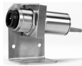
Sirius mit Haltewinkel HA11